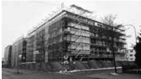
Baufortschritt auf Seite Bernstrasse

Die Fenster werden eingebaut und das Gebäude ist per Ende März 2017 dicht. Die Ausbau- und Innenausbauarbeiten (Schreinerarbeiten, Bodenbeläge etc.) sind am Laufen. Das Musterzimmer wurde auf Mitte Dezember 2016 fertiggestellt, die Musterwohnung ist auf März 2017 geplant.