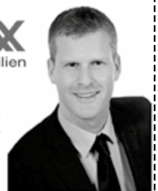
RE/MAX Ambassador Bernstrasse 131 3052 Zollikofen

Ihre einheimischen Experten für alle Fragen rund um Ihre Immobilie. Wir freuen uns auf Ihren Anruf.