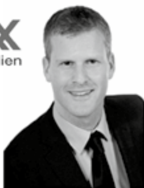
RE/MAX Ambassador Bernstrasse 131 3052 Zollikofen

Ihre einheimischen Experten für alle Fragen rund um Ihre Immobilie. Wir freuen uns auf Ihren Anruf.