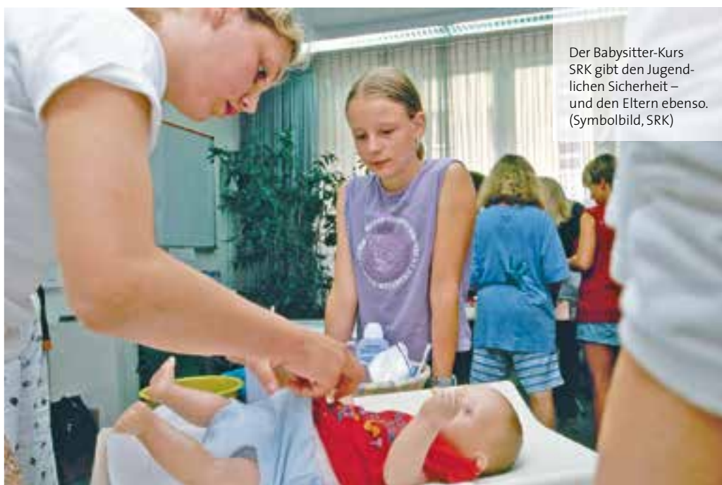
Der Babysitter-Kurs SRK gibt den Jugendlichen Sicherheit – und den Eltern ebenso. (Symbolbild, SRK)