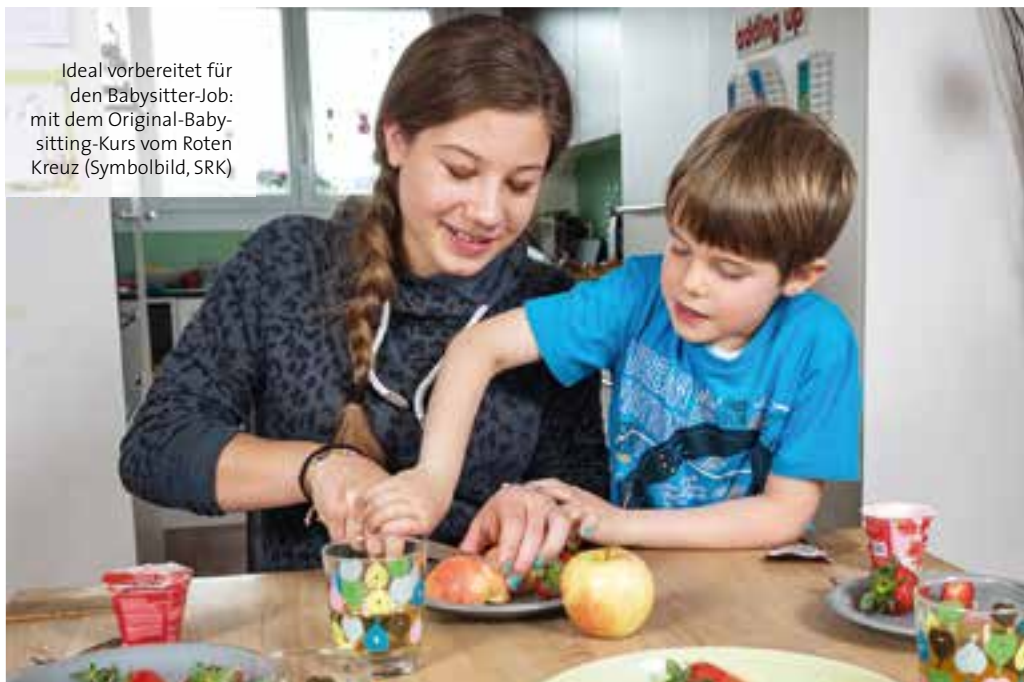
Ideal vorbereitet für den Babysitter-Job: mit dem Original-Babysitting-Kurs vom Roten Kreuz (Symbolbild, SRK)

Am Ende des zweiten Kurstages erhalten alle Teilnehmenden den SRK-Babysitting-Pass. Cécile (15) freut sich: «Den Babysitting-Pass kann ich den Eltern vorweisen. Dann wissen sie, dass ich seriös vorbereitet bin.»