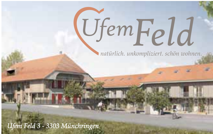
Ufem Feld 3 - 3303 Münchringen

Münchringen. Ein romantisches Dorf , das seinen Einwohnern die gute alte, verloren geglaubte Gemütsruhe wieder zurückgibt.