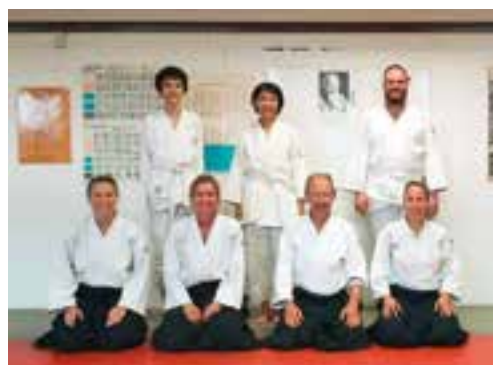
Lehrerteam für den Workshop

Weitere Informationen zum Förderprogramm unter https://aikidobern.ch/index.php/aikidofoerderprogramm .