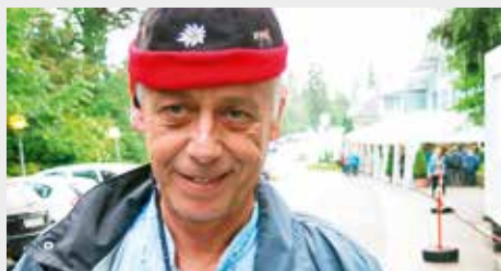
PETER LEU Theaterunternehmer Kolumnist

Ich brauche dringend mehr Platz! Ich suche eine 13-Zimmer-Villa! Mindestens zwei bis drei Badezimmer, zwei Küchen, drei Schlafzimmer, drei Wohn- und Esszimmer sollten es schon sein. Ein Gartensitzplatz in der Grösse eines Tennisfeldes, ferner Platz für rund 12 Gartenbeete, dazu rund drei Jucherten Rasen, einige Büsche, ein Geräteschuppen und eine grosse Werkstatt wären eine cheibe gäbige Ergänzung.