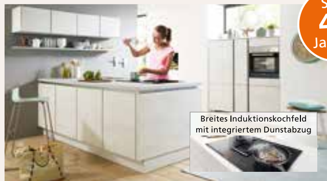
Breites Induktionskochfeld mit integriertem Dunstabzug

Alle Küchen sind erweiterungsfähig und beliebig änderbar. Alle Preise sind Vollservice-Preise. Inklusive Lieferung und Montage. Alle Küchen ohne Deko und Beleuchtung.