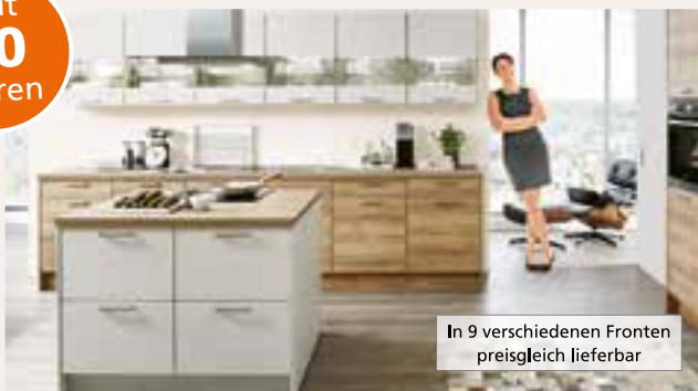
In 9 verschiedenen Fronten preisgleich lieferbar