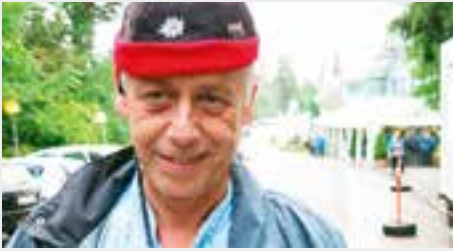
PETER LEU Theaterunternehmer Kolumnist

Nun hört man sie allenthalben wieder klagen und jammern: «Ach, schon wieder Weihnachten!», «Schon wieder Ende Jahr!», «Wie die Zeit vergeht!», oder «Wo die Zeit nur geblieben ist?»