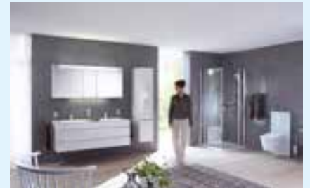
Grosse Wohnbäder ab 15 m 2 zum Verbleiben und Geniessen.

Niederwangen , Riedmoosstrasse 10, 031 980 13 32 • Lyssach , Lyssach-Center, Bernstrasse 9, 034 428 21 40 • Thun , Aarezentrum, Aarestrasse 30a, 033 225 14 44 • Langnau i. E. , Ilfis Center, Sägestrasse 37, 034 408 10 42