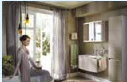
Mittelgrosse Bäder von 9 bis 15 m 2 mit anmutiger Eleganz.