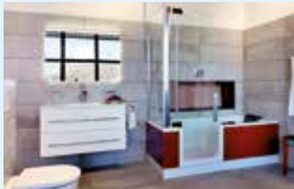
Kleine Bäder von 2 bis 9 m 2 mit Dusche und Badewanne in einem.