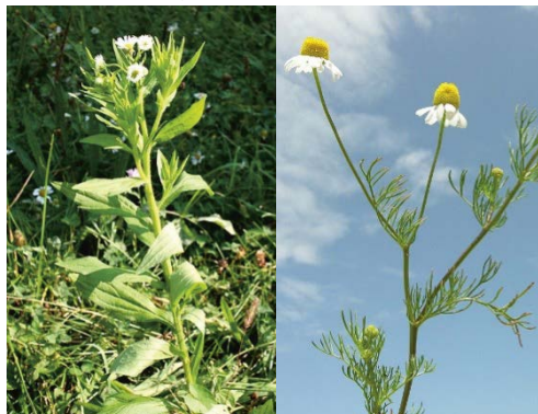
Einjähriges Berufskraut (l.) und Echte Kamille (r.)

Beobachtungen von Pflanzen und Tieren melden www.infospecies.ch > Daten