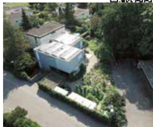
Garten, ein Jahr nach der Umgestaltung (2021)