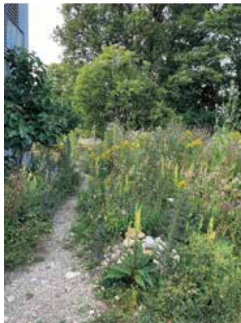
Wildblumenwiese im Juni 2023

Schon seit einigen Jahren haben wir uns mittels Fachliteratur informiert und auch einige Kurse besucht, namentlich zum Thema Permakultur. Für die Umgestaltung zogen wir einen Gartengestalter als Berater bei, um unsere Ideen fachgerecht umsetzen zu können. Wir erklärten ihm unsere Vorstellungen und er erstellte uns eine Skizze. Er half uns vor allem auch bei der Auswahl der heimischen Pflanzen, die wir dann in Gruppen anordneten. Der Einbezug der Fachperson war wichtig. Es half uns, standortentsprechende Zonen zu bilden (Schatten, Halbschatten, sonnig) und wichtige Gestaltungselemente einzusetzen wie z. B. einen Hügel oder eine Trockenmauer.