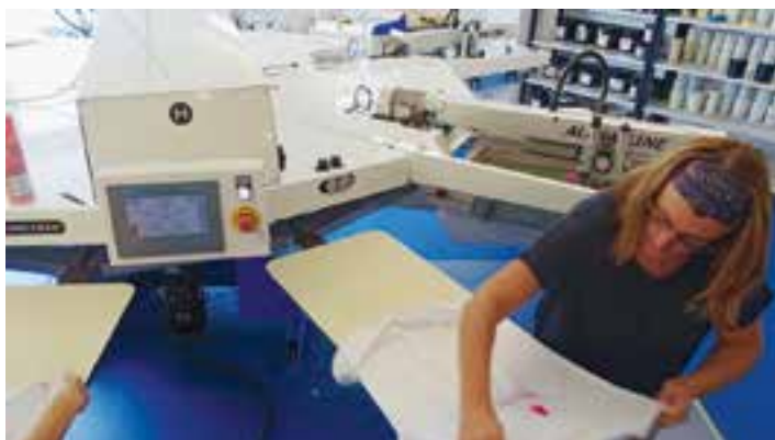
Arbeit am modernen 12-armigen Druckkarusell.