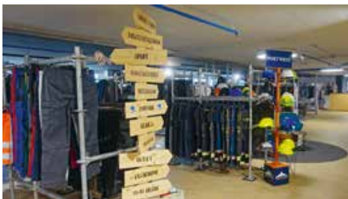
Erlebnisraum mit Wegweiser.