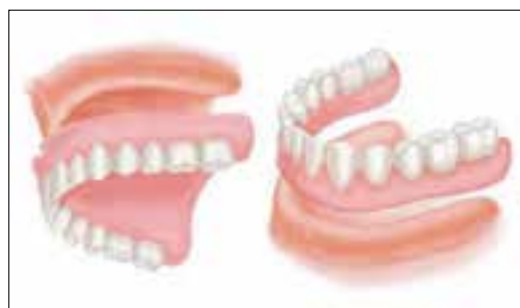
Totalprothesenpaar bei zahnlosem Ober- und Unterkiefer

Die Studie wird ca. 1,5 Jahre dauern. Zunächst werden wir in einem kurzen Termin (ca. 30 min) überprüfen, ob Sie für die Studie in Frage kommen. Falls dies so ist, werden wir Sie für einen längeren Termin von ca. 3 Stunden für einen ausführlichen Befundungs- und Befragungstermin einladen. Im Anschluss daran werden Sie im Studentenkurs an den ZMK Bern mit zwei Totalprothesenpaaren nach dem Gerber- und BPS-System versorgt. Hierfür werden ca. 8 Sitzungen von je ca. 3 Stunden benötigt. Diese Sitzungen sind nicht Teil der Studie. Sind beide Totalprothesenpaare (Gerber- und BPS-System) fertiggestellt, werden Sie zunächst das eine der beiden Paare für 3 Monate tragen und dann jeweils das andere wiederum für 3 Monate. Nach den 3-monatigen Trageintervallen werden jeweils wiederum Kontrolltermine von ca. 3 Stunden durchgeführt. Welches der beiden Paare als erstes eingesetzt wird, entscheiden wir ganz am Anfang und per Münzwurf. Nachdem Sie beide Prothesenpaare für jeweils 3 Monate getragen haben, entscheiden Sie sich für eines der beiden Paare. Dieses tragen Sie dann für 12 Monate. Nach dieser Zeit bitten wir Sie für einen Kontrolltermin an die ZMK Bern zurück.