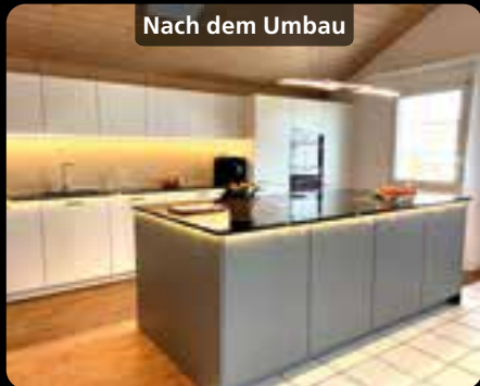
Nach dem Umbau