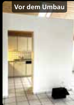
Vor dem Umbau