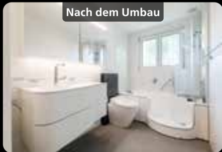
Nach dem Umbau