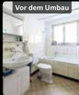
Vor dem Umbau