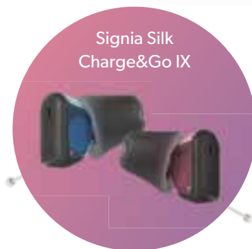
Signia Silk Charge&Go IX