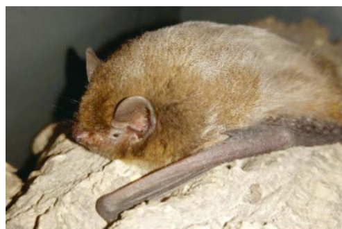
Zwergfledermaus, © Elia Schmitter

Anmelden können Sie sich telefonisch oder per Mail bei der Bauverwaltung Zollikofen, 031 910 91 26, eli-a.schmitter@zollikofen.ch.