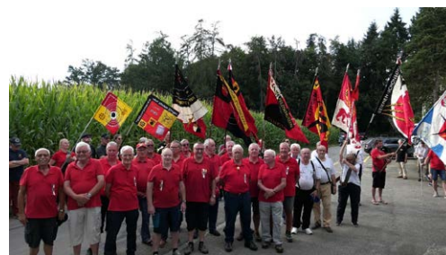
Unsere stolzen und erfolgreichen Veteranen vor dem Fahnenmeer