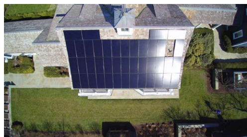
Todd Druskat, U.S. Department of Energy. Public Domain.